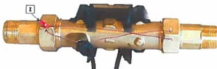
Рисунок 1. Места пломбировки