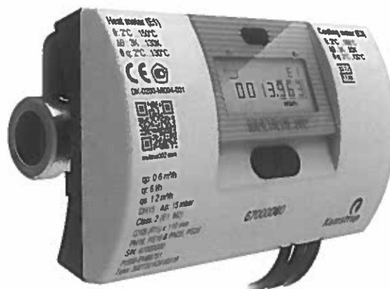
Фото 1. Фотография общего вида

Общий вид теплосчетчика представлен на фото 1.